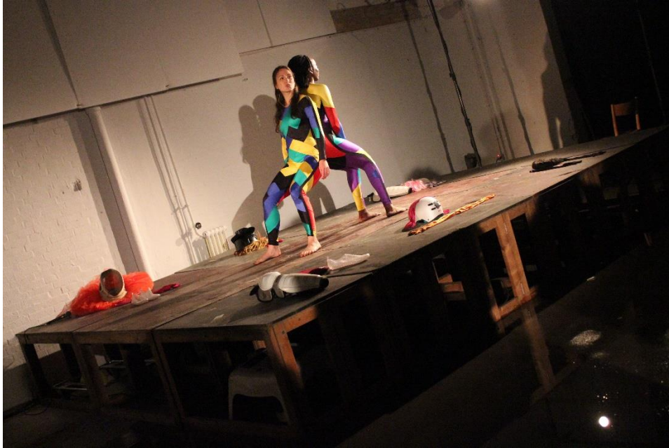
Fotografi © Agnes Grelinger

gange reflekterende om opfattelse af race, alder og køn (I wonder if I should become pregnant soon at my age). Det er lidt skiftende, hvor meget improvisationen lykkes. Nogle gange kan de godt give slip og bare køre associationer, men nogle gang kommer selvhæmninger, hvor associationerne desværre ikke folder sig ud. Så vidt jeg ved, handler "teknikken" (snak under bevægelse) netop om at frigøre tankerne, men det er nok sværere at opnå, end man tror.