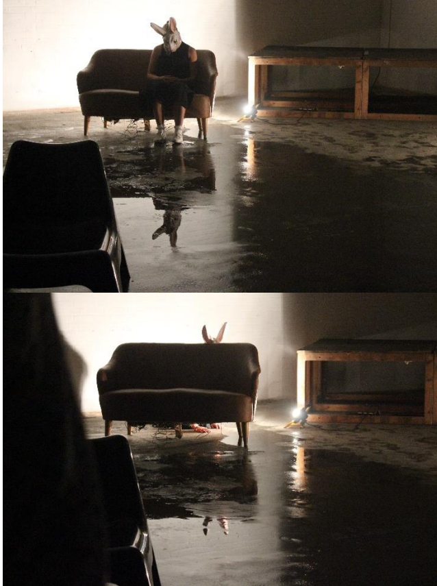
Fotografi © Agnes Grelinger

En pige i skoleuniform dukker op. Hun opdager ikke kaninen, så hun danser frit og graciøst. Begge to danser de til en let sommersang, indtil pigen opdager kaninen og løber skrigende væk. Stemningen skifter igen til at være skrækkelig. Kaninen står stille, mens der spilles skiftevis truende musik og seriøs tekst fulgt af kunstig latter. Der er også lidt Hitchcock over det og en forvirrende komisk-frygtelig stemning. Der er også noget queer, noget mismatch i at kombinere de to vildt forskellige elementer (glade og frygt).