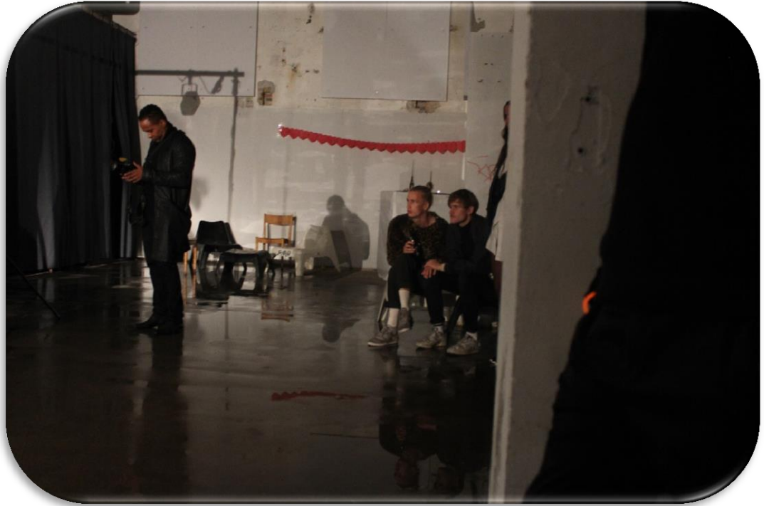
This is not a festival

Den femte performance er igen på scenen. Halvdukke-halvmenneske, eller en slags siamesertvilling. Mennesker er i baggrunden, men han bevæger dukken. Dukken er grotesk og deformeret. Hun er glamourøs og grotesk samtidig. Sexy og vulgær. Enormt frastødende og ulækker, men også tiltrækkende. Hun begynder at synge, men der kommer lige pludselig en mands stemme ud af hendes mund. Hun opdager sin skygge. Den side af sig selv, som hun har undertrykt. Den vil nu tage hævn og dræbe dukken. Det kan minde os om The Picture of Dorian Gray af Oscar Wilde eller The Nightmare af Mihály Babits. Situationen virker absurd, og den forstærkes med absurde elementer, fx at dukken bøvser en pistol ud, som hun snart bliver skudt med. Men ved at dræbe dele af selvet, bliver resten også paralyseret, og til sidst dør det også. Da performance slutter, bukker mennesket og dukken sammen som en uopdelelig enhed.