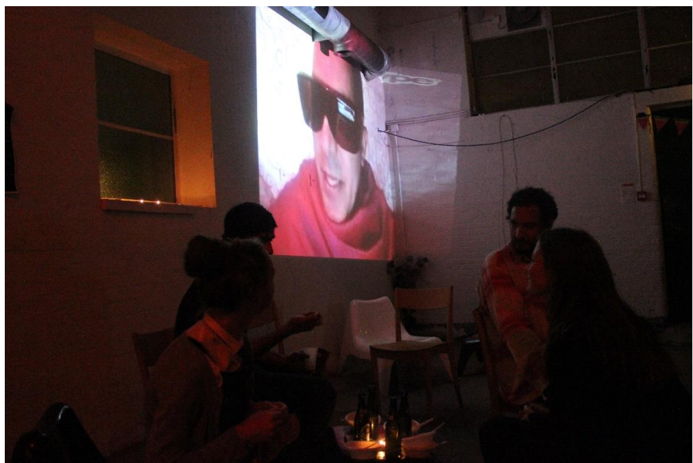
Med vores guru

I denne performance er vi forbundet med en mand gennem Skype, og han er projekteret på en skærm på væggen. Det er lige som en meditation: Han giver os instruktioner og gentager dem igen og igen, som et mantra. Vi får makeup sæt uddelt af Luis, og vi skal lukke vores øjne og bare bruge de forskellige farver. Da der ikke er så mange sæt, er vi nødt til at samle os i grupper, så performancen er ikke bare interaktiv, men skaber også mindre fællesskaber indenfor det store. Jeg er virkelig dårlig til at lægge make-up på, og håber at jeg ikke vil se helt åndsvagt ud bagefter. Min veninde beroliger mig. Uanset hvad: performancens fokus ligger i sanseoplevelsen: sansning af berøring af øjenlåg med fingrene. Vores hud der er nemlig meget sensitiv. Performancen fortsætter med at udforske vores sanser: hver gruppe får en pose toastbrød og noget peanutbutter. Vi skal smørre brødet og spise det med lukkede øjne. Siden sommeren har jeg haft lyst til at spise peanutbutter, da det stod på min mors hylde i Ungarn og kiggede på mig hver gang, jeg åbnede skabet. Men jeg ikke vil