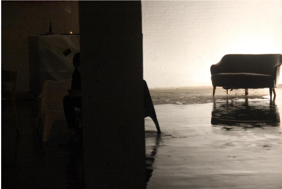
This is not an IKEA catalogue

I denne performance er vi forbundet med en mand gennem Skype, og han er projekteret på en skærm på væggen. Det er lige som en meditation: Han giver os instruktioner og gentager dem igen og igen, som et mantra. Vi får makeup sæt uddelt af Luis, og vi skal lukke vores øjne og bare bruge de forskellige farver. Da der ikke er så mange sæt, er vi nødt til at samle os i grupper, så performancen er ikke bare interaktiv, men skaber også mindre fællesskaber indenfor det store. Jeg er virkelig dårlig til at lægge make-up på, og håber at jeg ikke vil se helt åndsvagt ud bagefter. Min veninde beroliger mig. Uanset hvad: performancens fokus ligger i sanseoplevelsen: sansning af berøring af øjenlåg med fingrene. Vores hud der er nemlig meget sensitiv. Performancen fortsætter med at udforske vores sanser: hver gruppe får en pose toastbrød og noget peanutbutter. Vi skal smørre brødet og spise det med lukkede øjne. Siden sommeren har jeg haft lyst til at spise peanutbutter, da det stod på min mors hylde i Ungarn og kiggede på mig hver gang, jeg åbnede skabet. Men jeg ikke vil