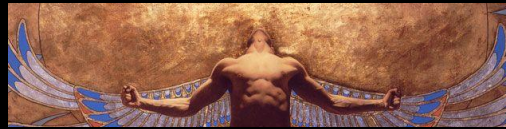
Ikaros' flygning (The Flight of Icarus) af Gabriel Picart

The study concluded "it is clear that we cannot distinguish the sane from the insane in psychiatric hospitals" and also illustrated the dangers of dehumanization and labeling in psychiatric institutions.