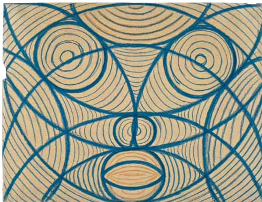
Vaslav Nijinsky: Arcs and segments: lines, Crayon on pencil, c. 1918/19.

Tilsyneladende har det grafiske udgangspunkt for den mentalt desorienterede Nijinskij været de mennesker og den dans, han kendte til. Men hurtigt arbejdede han sig ud i et ingenmandsland af rene urformer, cirkelsegmenter,