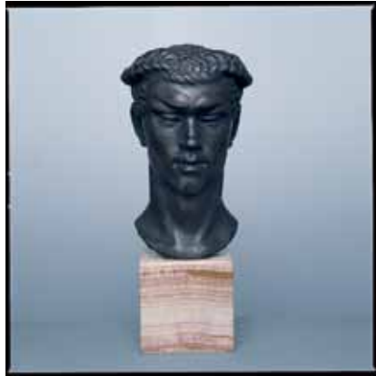
Una Troubridge: Vaslav Nijinsky, Bronze, 1912-13. Foto: © Stiftung John Neumeier – Dance Collection