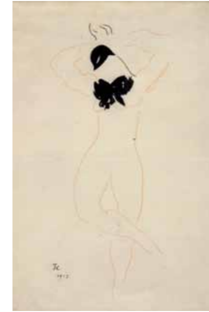
Jean Cocteau: Vaslav Nijinsky in "Le Carnaval", Crayon and ink, 1912.