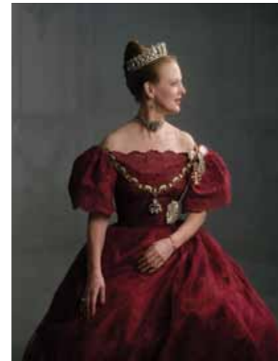
H.M. Dronningen som 50-årig, 1990.

I 1998 kunne Det Kgl. Teater fejre sit 250 års jubilæum, og i den anledning skabte John Neumeier balletten 1963:Yesterday som sit personlige billede af forholdet til Den Kgl. Ballet. Vittigt og elegant blev Neumeiers første