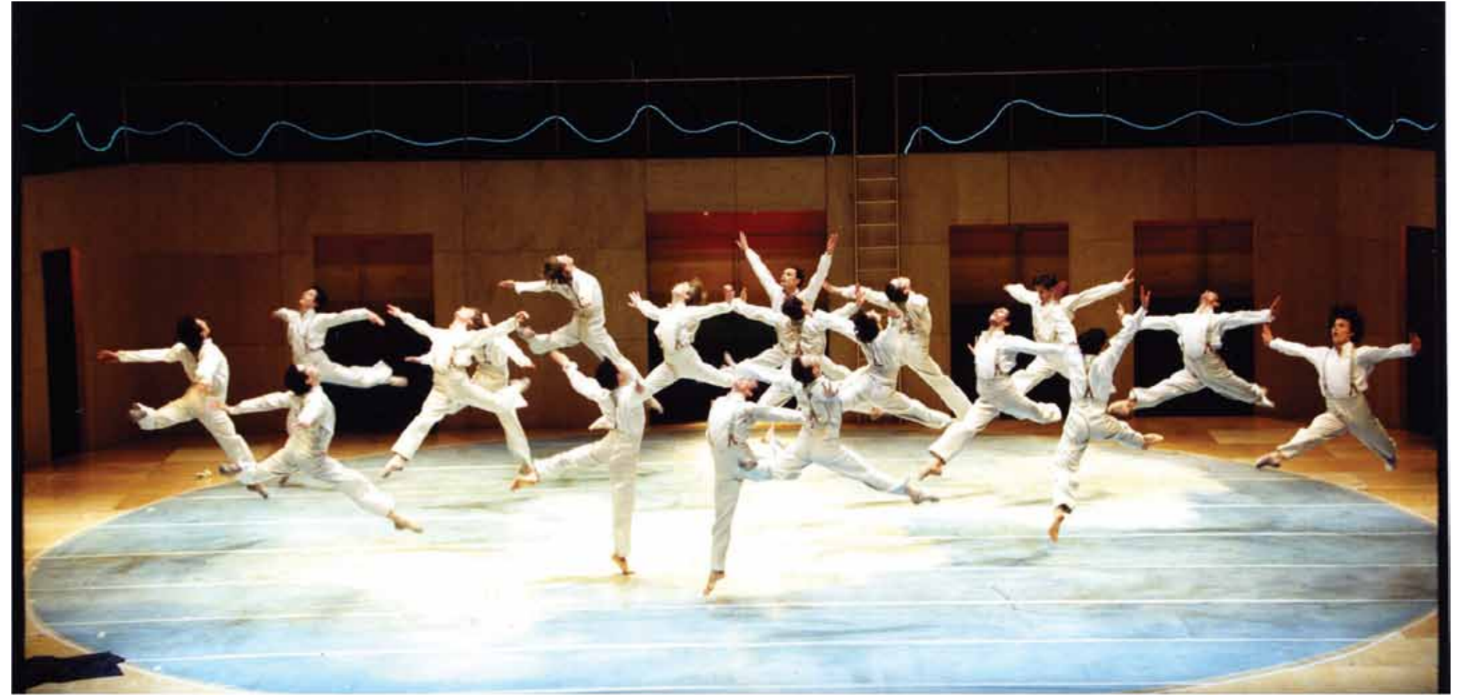
Odysseen. Hamburg Ballett. Ballet af John Neumeier. Dansere: Ensemble.