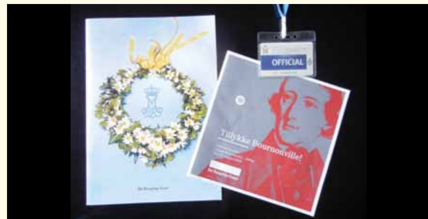
Programmer fra H.M. Dronning Margrthes 50 års fødselsdag og fra Tillykke Bournonville i anledningen af hans 200 års fødselsdag samt VIP-kort fra en optrædende fra gallaforestillingen aftenen før Frederiks og Marys bryllup.