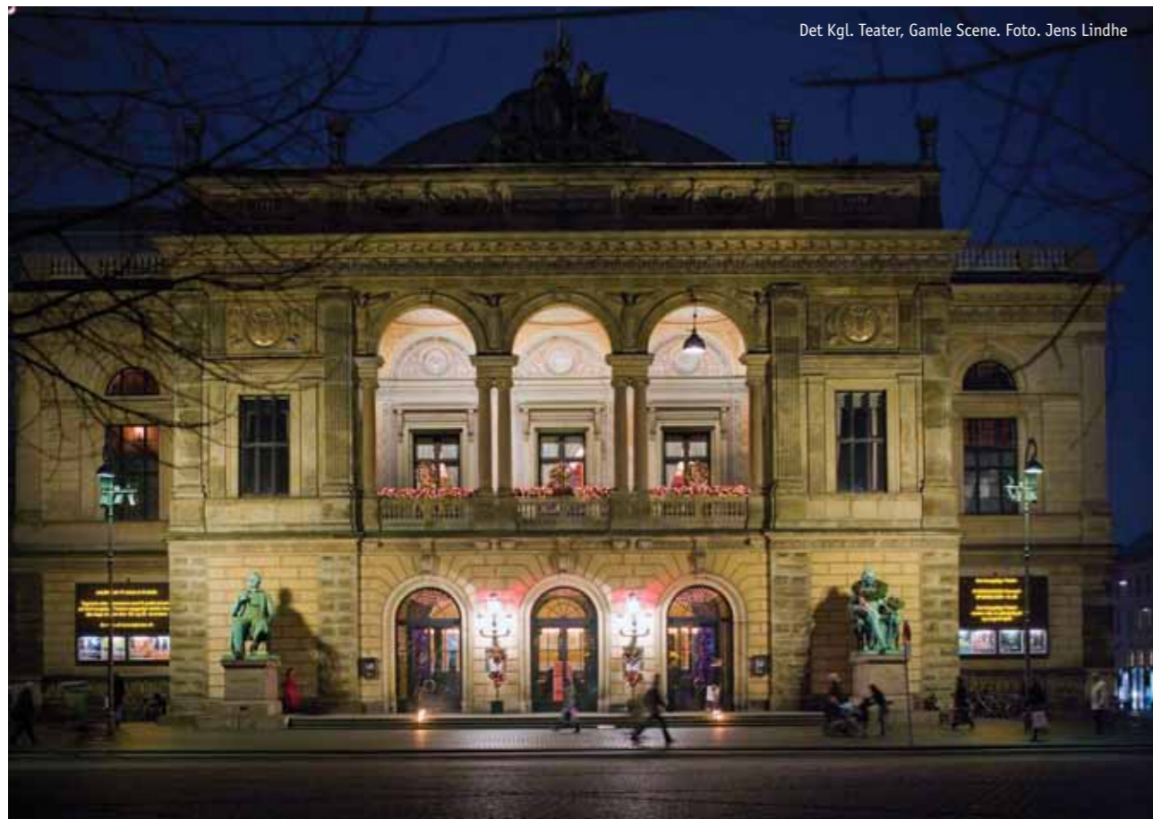
Det Kgl. Teater, Gamle Scene.

Koreografen John Neumeier har siden begyndelsen af 1960'erne haft en ganske særlig tilknytning til Den Kgl. Ballet. Som ung danser kom Neumeier til København og fik undervisning af den legendariske balletpædagog Vera Volkova, og samtidig mødte han Bournonville-traditionen og blev fascineret af de muligheder, der lå i stilen, verdens ældst bevarede. Kærligheden til København og Den Kgl. Ballet har siden hen båret frugt i form af de store helafteftsballetter som Romeo og Julie , En Skærsommernatsdrøm , Amleth , Odysseen og senest Kameliadamen . Dertil kommer værker skabt til særlige lejligheder.