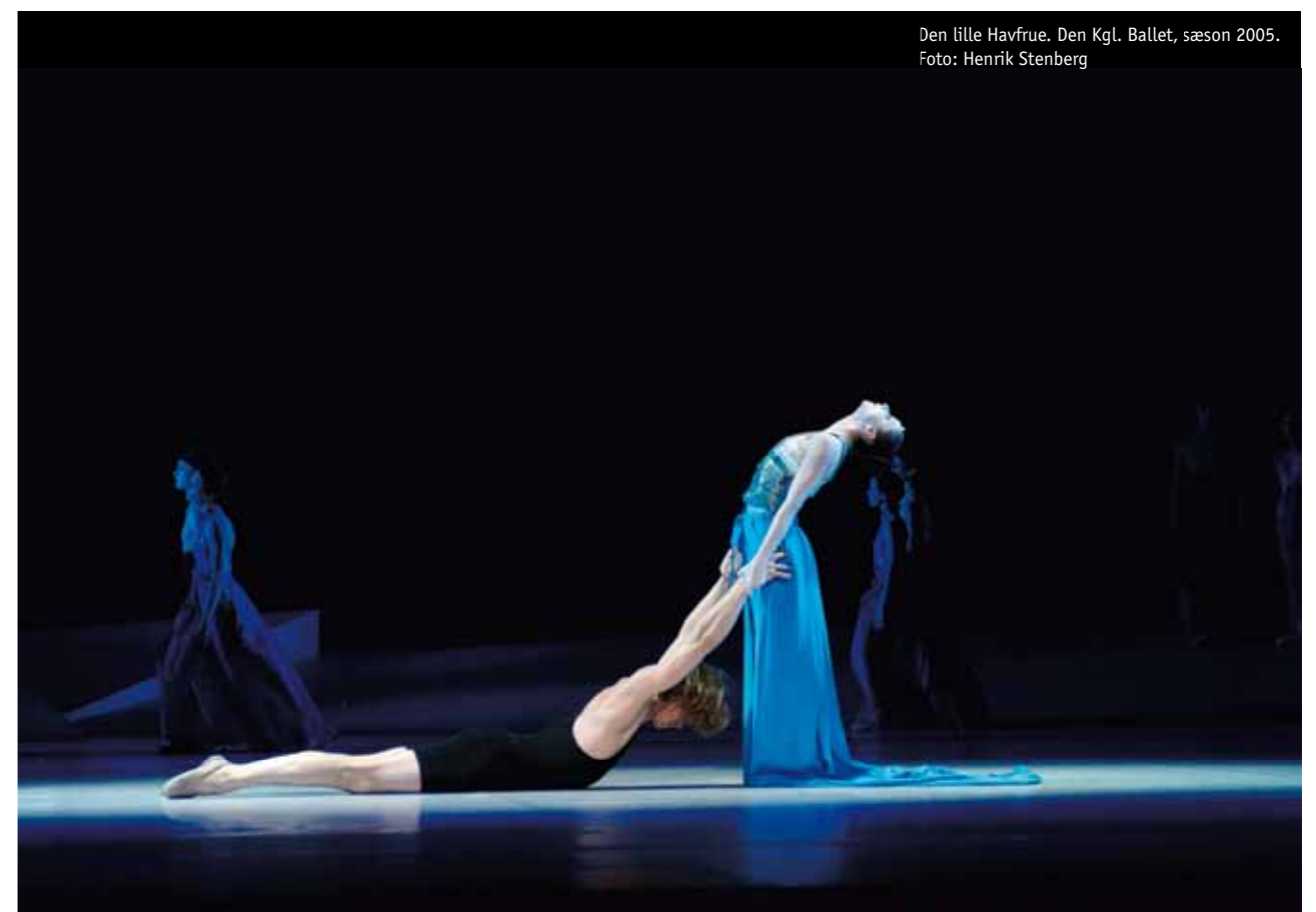
Den lille Havfrue. Den Kgl. Ballet, sæson 2005.