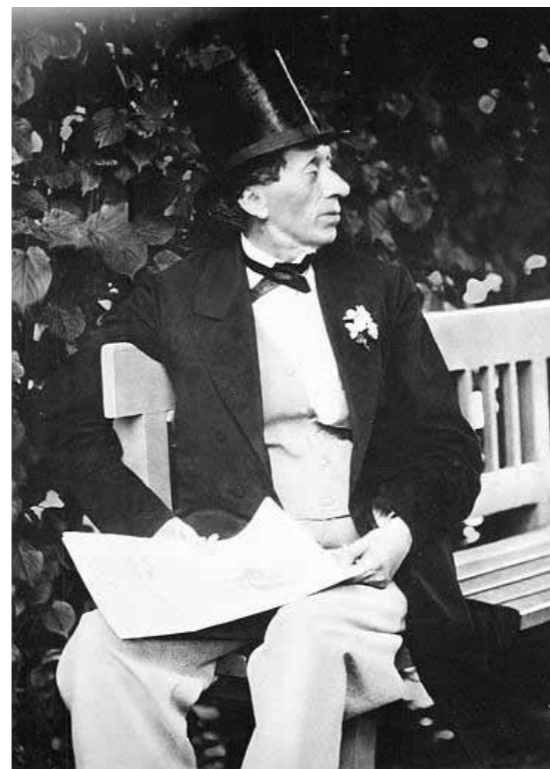
Neumeier & København